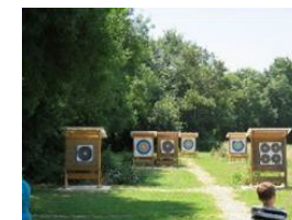
Terrain du Pré de la Cure Route de Saint Mathurin

(Les Archers du Val d'Authion sur google.maps)