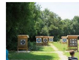
Terrain du Pré de la Cure Route de Saint Mathurin (GPS : 47°27'10.6"N 0°16'42.0"W)